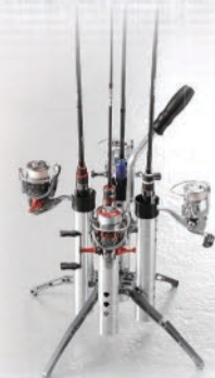
ロッド収納イメージ