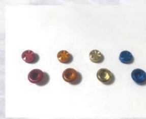
リペアセンタービス&ノブキャップセット