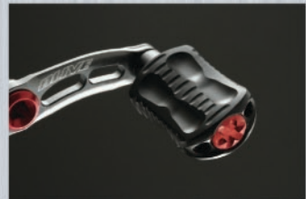
ノブ単体で脅威の2.5g！ 樹脂素材を使用し冬季の冷たさも軽減。 純正ノブに変更も可能。 (クリアランス調整シムも同梱)

ダブルハンドルなのに重量がデメリットにならない革命。 ダイワ用65mmの重量はわずか17.5g。この重量は純正のシングルハンドルを凌駕する軽さ。 ダブルハンドルの最も大きなメリットはリトリーブの安定感。そして軽さからくる感度とシングルハンドル並みの 初速の速さを兼ね備えたスペシャルビレットハンドルが誕生。 アルミならではの軽さと剛性を兼ね備えた性質は大型魚とのファイトも力負けせず、しなりがないので 食い渋った浅いバイトもロスなくフッキングさせることが可能。 DLIVE標準装備のノブは他にはない樹脂の削り出し。 樹脂は冬季の冷たさが軽減され、軽量でお手入れもしやすい素材。削りだから出来る細かいスリットや形状で滑りを防止。 DLIVEでは1つのノブに2個ベアリングを使用した2BB仕様。防錆処理済みベアリングでソルトでの使用も問題ありません。