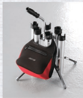
+2本増設イメージ (6本仕様)