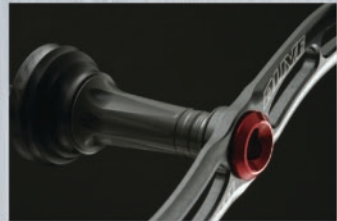
軽量と剛性を兼ね備えた アルミビレットこだわりのディティール