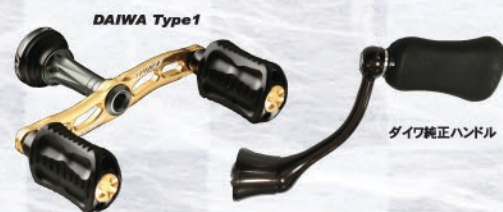
DAIWA Type 1

Product name : Custam handle reel case L Main material : Neoprene Price : 2100yen (plus tax)