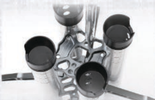
アルミピレットの天板 徹底的な肉抜きにより軽量化

Product name : Rod stand FORCE Main material : Aluminium & POM resin Weight : 900g Price : 34800yen (plus tax)